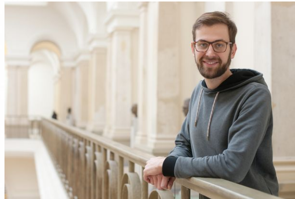
Georg P. Kössler MdB Sprecher für Klima- und Umweltschutz, Eine-Welt-Politik und Clubkultur

Grün im Kiez Büro Braunschweiger Str. 71 12055 Berlin-Neukölln www.georg-koessler.de